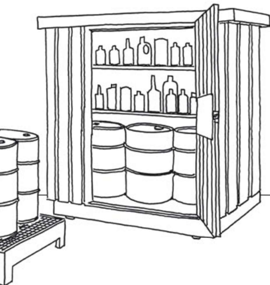
Stativ med spildbakke til tromler Spildbakke til tromler Aflåseligt skab

Ved akut fare for forurening, ved spild på jord eller udledning til kloak, skal alarmcentralen kontaktes på telefon 112. Den der forårsager forureningen er ansvarlig for, at anmelde forureningen til Miljøafdelingen i Teknisk Forvaltning.