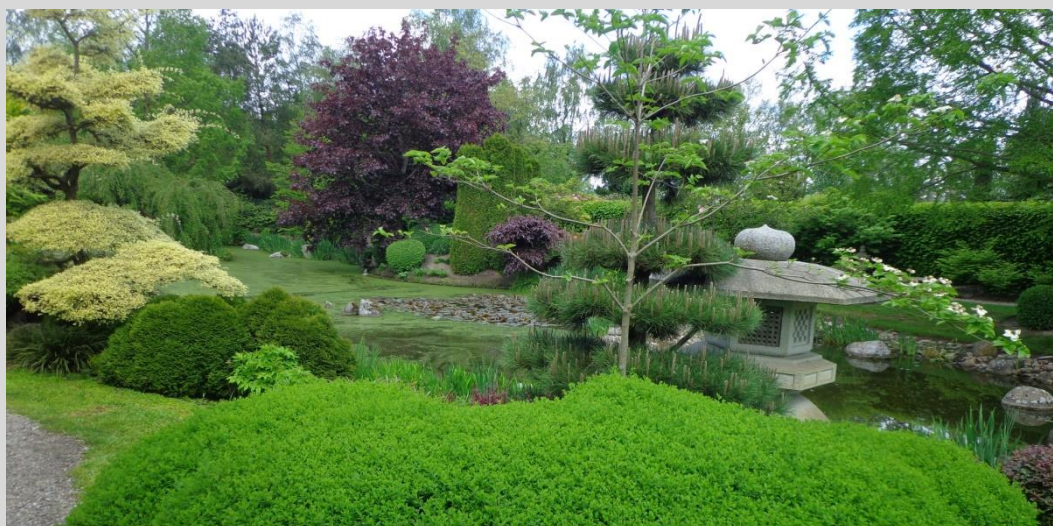
Skovtur til Birkegårdens Haver 2019

Godkendt i Seniorrådet 16. december 2019.